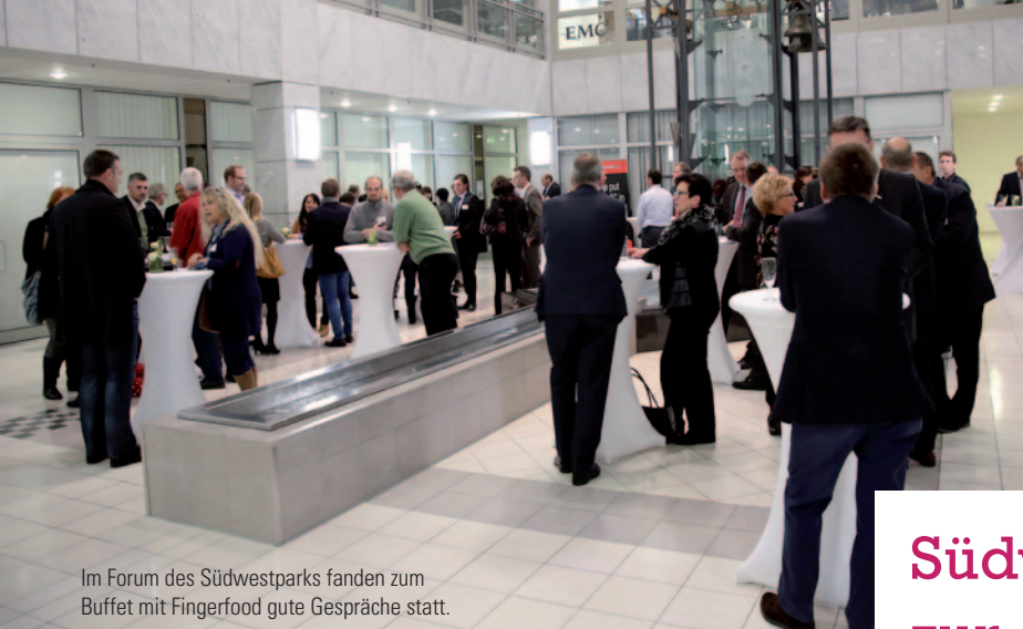
Im Forum des Südwestparks fanden zum Buffet mit Fingerfood gute Gespräche statt.