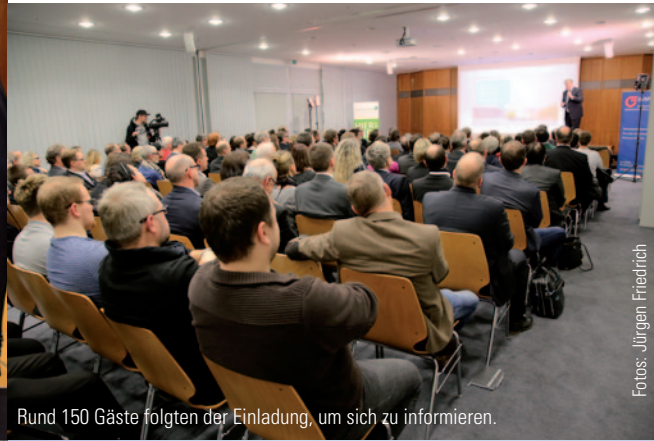
Rund 150 Gäste folgten der Einladung, um sich zu informieren.